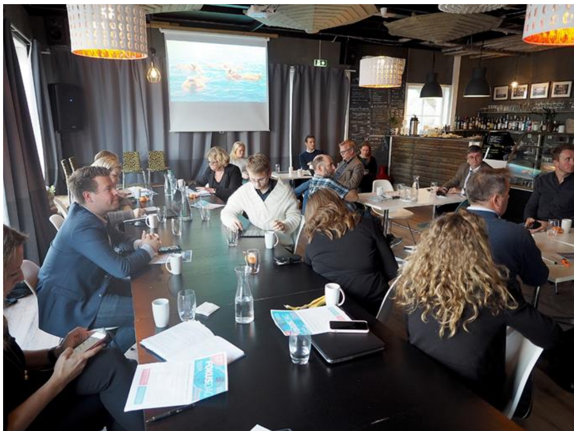
Fra fokusdagen til Steigen Næringsforum på Nybrygga.